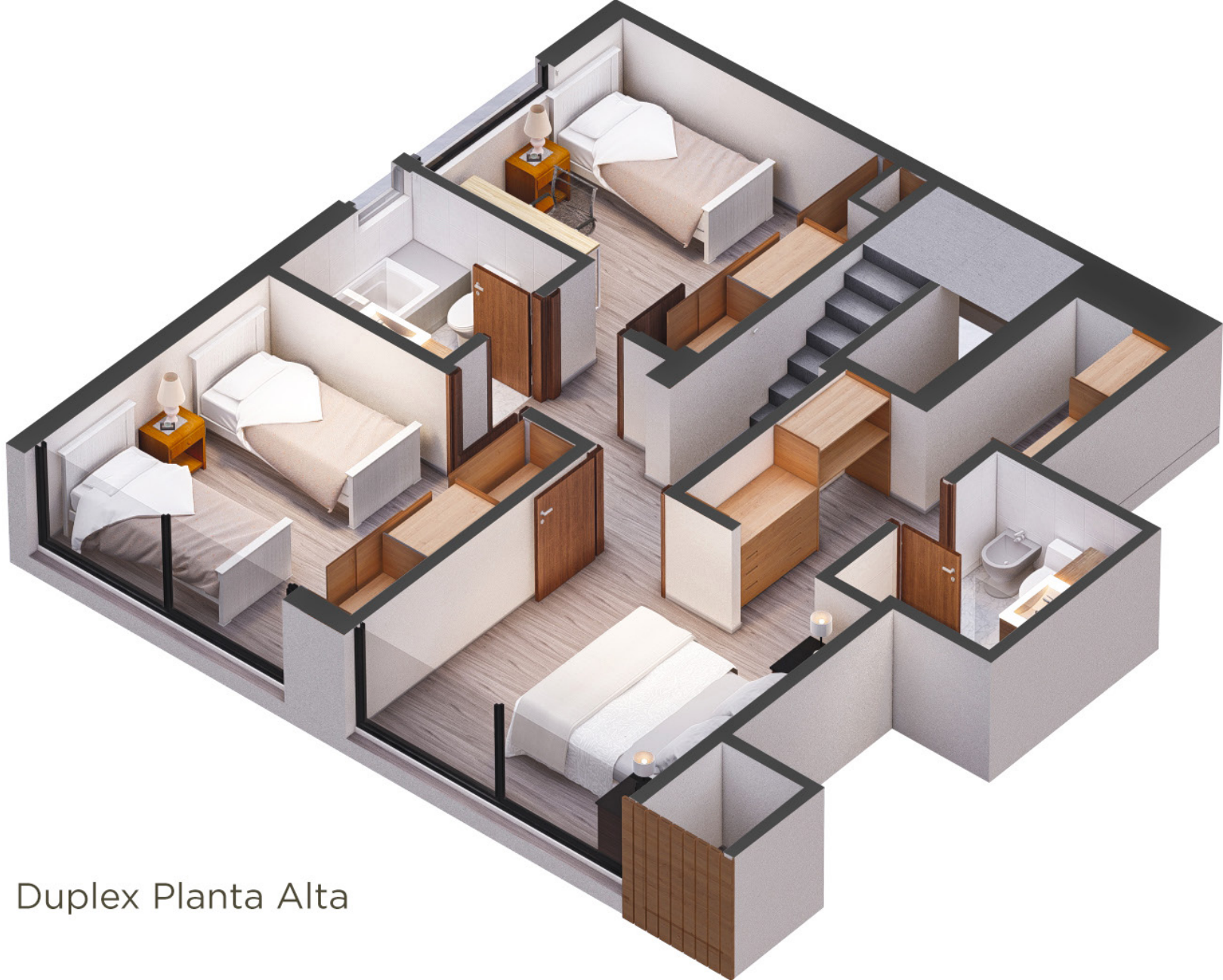
Duplex Planta Alta