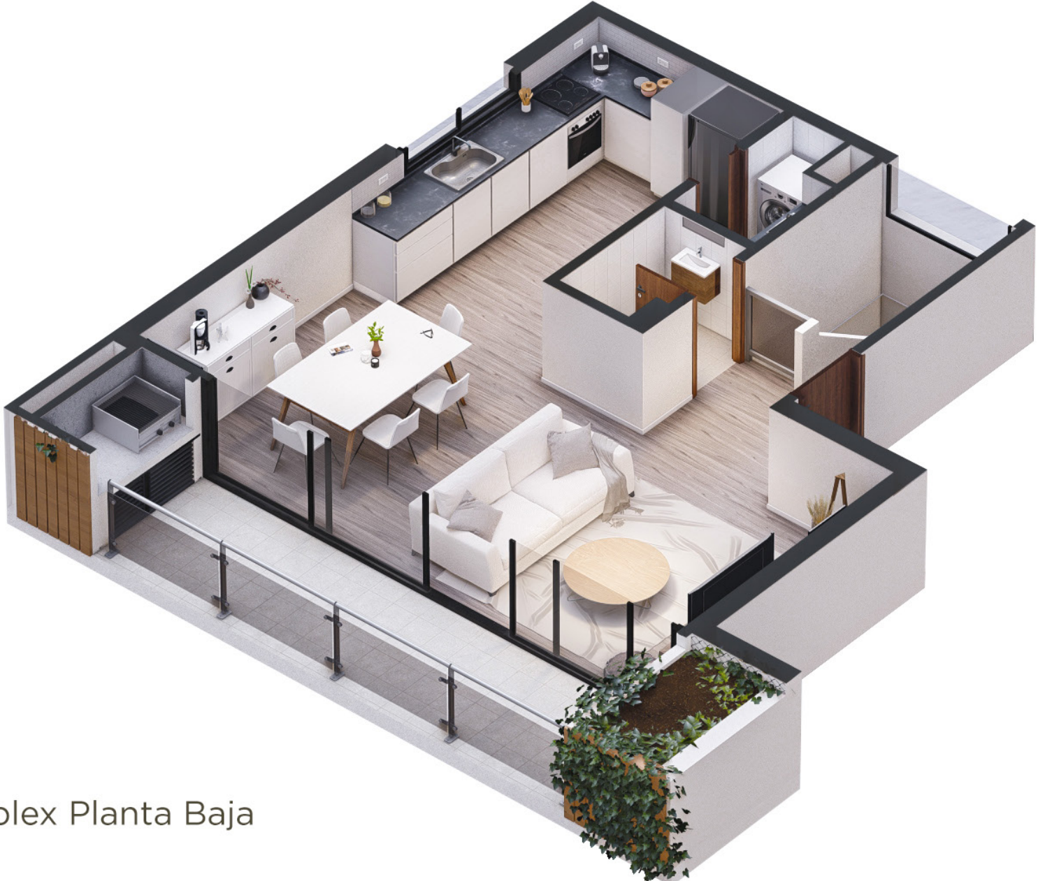
Duplex Planta Baja